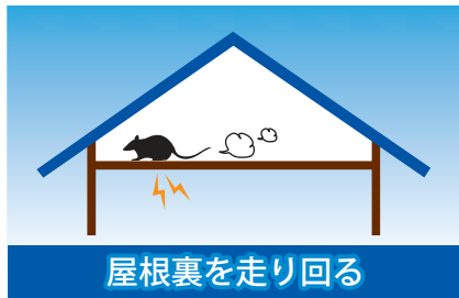
屋根裏を走り回る