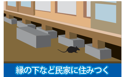
縁の下など民家に住みつく