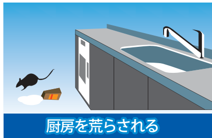
厨房を荒らされる