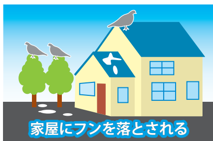
家屋にフンを落とされる