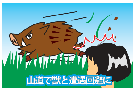
山道で獣と遭遇回避に