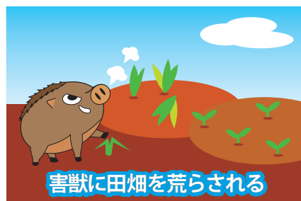
害獣に田畑を荒らされる